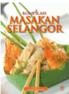
ALAF Kompilasi Masakan Selangor RM 7.00

Tajuk : Kompilasi Masakan Nyonya Pengarang : Sa'adiyah Mohamad Penerbit : Alaf 21 Sdn Bhd ISBN : 978-983-124-382-4 Mukasurat : 64 Halaman Status Stok : ADA [ Product Details... ]