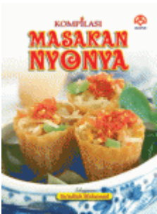
ALAF Kompilasi Masakan Nyonya RM 7.00

Tajuk : Kompilasi Masakan Nyonya Pengarang : Sa'adiyah Mohamad Penerbit : Alaf 21 Sdn Bhd ISBN : 978-983-124-382-4 Mukasurat : 64 Halaman Status Stok : ADA [ Product Details... ]