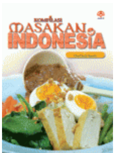
ALAF Kompilasi Masakan Indonesia RM 7.00